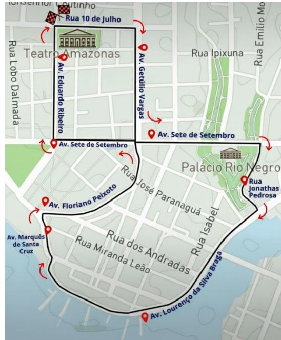
Figura 1: Percurso ilustrativo da prova